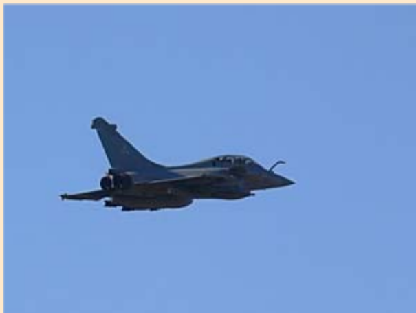
Passage du Rafale