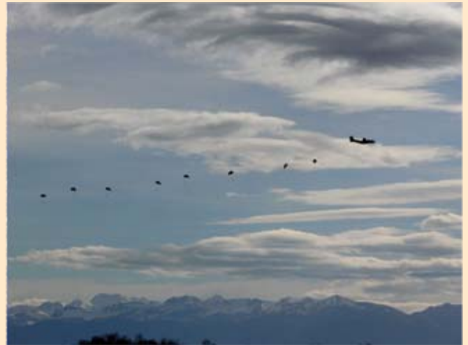
Les parachutistes de l'ETAP à l'entraînement sautant sur la zone Wright, vus depuis le parking de l'aéro-club du Béarn.