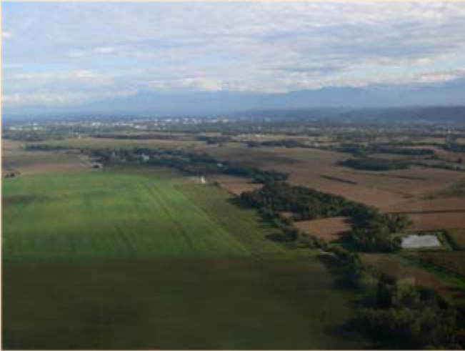
Une vue de la zone Wright, située au sud-ouest de l'aéroport de Pau-Pyrénées. Au fond, la ville de Pau.

Les frères Wright avaient en 1909 installé leur école de pilotage sur la Lande du Pont-Long, au Nord-Ouest de Pau. Aujourd'hui, cette zone, la zone de saut Wright, est utilisée par les militaires de l'ETAP (Ecole des troupes Aéroportées) comme zone de saut pour l'entraînement des parachutistes.