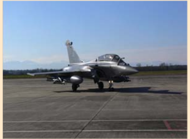
Présentation du Rafale devant les invités de la cérémonie

Les deux appareils sont venus stationner devant les invités, et plusieurs personnalités ont pu s'approcher pour les observer de plus près.