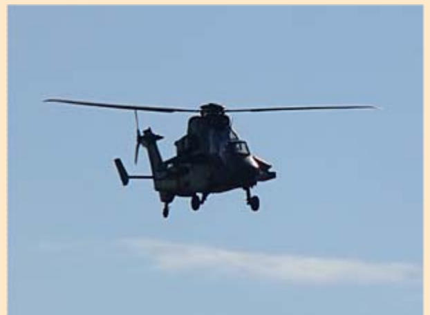
Passage d'un Tigre du 5ème RHC

La cérémonie s'est comme il se doit terminée autour d'un buffet offert par la CCI dans les locaux de l'aéroport Pau-Pyrénées, et auquel tous les invités ont fait largement honneur.