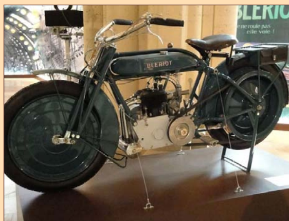
Une moto Blériot

Louis Blériot a par la suite également été constructeur de motos, l'une d'entre elles étant du reste présentée à l'exposition.