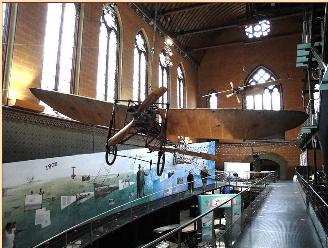
Le Blériot XI de la traversée de la Manche au Musée des Arts et métiers à Paris

Tout d'abord parce que ce musée, aux collections permanentes au demeurant remarquables, et qui méritent le déplacement, est le lieu où l'on peut voir l'exemplaire authentique du Blériot XI avec lequel l'aviateur a accompli son exploit du 25 juillet 1909.