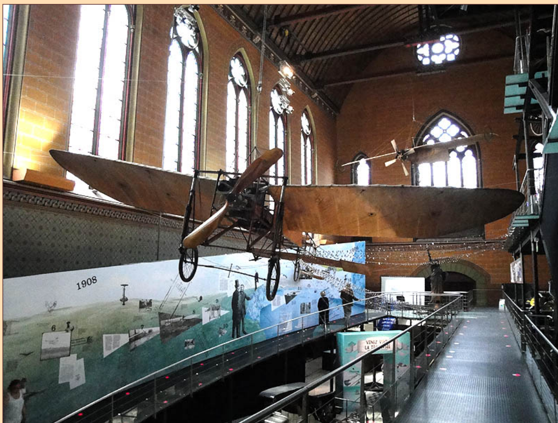
Le Blériot XI de la traversée de la Manche au Musée des Arts et métiers à Paris

Tout d'abord parce que ce musée, aux collections permanentes au demeurant remarquables, et qui méritent le déplacement, est le lieu où l'on peut voir l'exemplaire authentique du Blériot XI avec lequel l'aviateur a accompli son exploit du 25 juillet 1909.