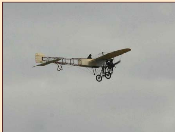
Le Blériot XI présenté en vol à Pau

6-7 Juin 2009 : Présentation en vol du Blériot XI au meeting aérien de Pau : ce fut sans doute un des moments les plus forts de ce meeting