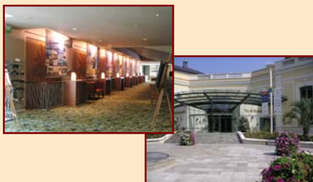
9/- L'exposition Wright au Palais Beaumont, en face duquel se trouve en outre une dalle en l'honneur des "Ecoles d'Aviation du Pont-Long"