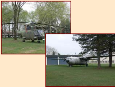
5/- Le musée des parachutistes, et les appareils en exposition statique