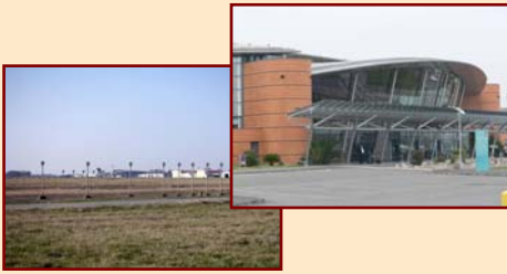
1/- L'aéroport de Pau, côté pile... et face. Il est situé sur l'emplacement de la première école des frères Wright