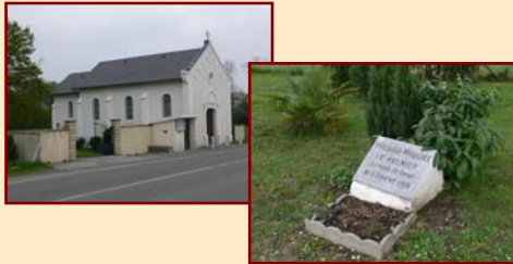
3/- La chapelle Mémorial de l'aviation, consacrée à la mémoire des pionniers