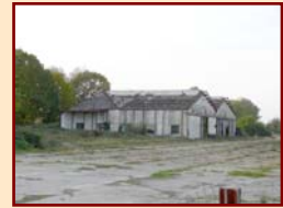
4/- Les hangars Guynemer, constructions historiques dues à Gustave Eiffel. Pourra-t-on les sauver ?