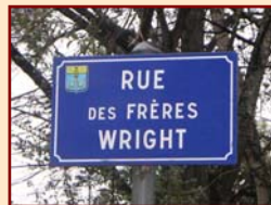
7/- La Rue des frères Wright, à Pau (il y a aussi les rues Védrières, Roland-Garros, Paul-Tissandier, Norman-Prince...)