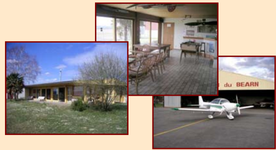
2/- L'aéro-club du Béarn, héritier de l'école des frères Wright