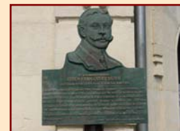
8/- La plaque à la mémoire de Jesús Duro, pionnier de l'aérostation, à la gare du funiculaire