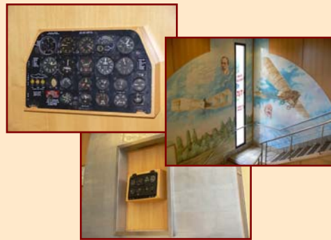
6/- Le MacDonald de la route de Bordeaux, où sont présentés divers vestiges et images de l'aviation. Etonnant, non ?