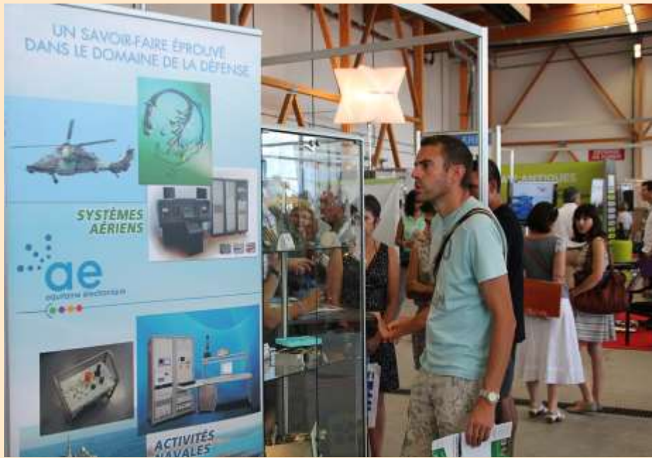
Dans les stands...