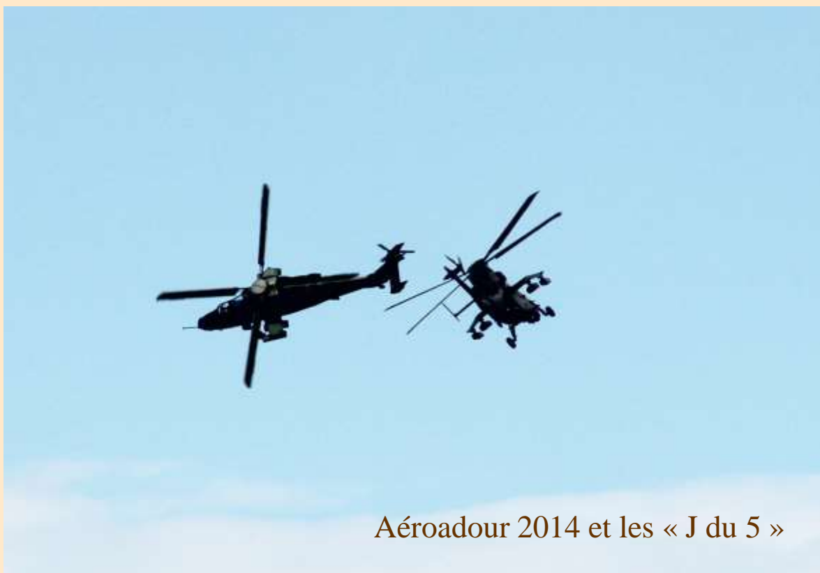
Aéroadour 2014 et les « J du 5 »

Pour sa troisième édition, le salon Aéroadour a connu le succès, professionnel et populaire. Servie par un temps radieux, cette manifestation, qui est désormais bien ancrée dans le paysage palois, illustre bien la dualité et la complémentarité économique de l'industrie aéronautique et des activités de défense dans nos territoires.