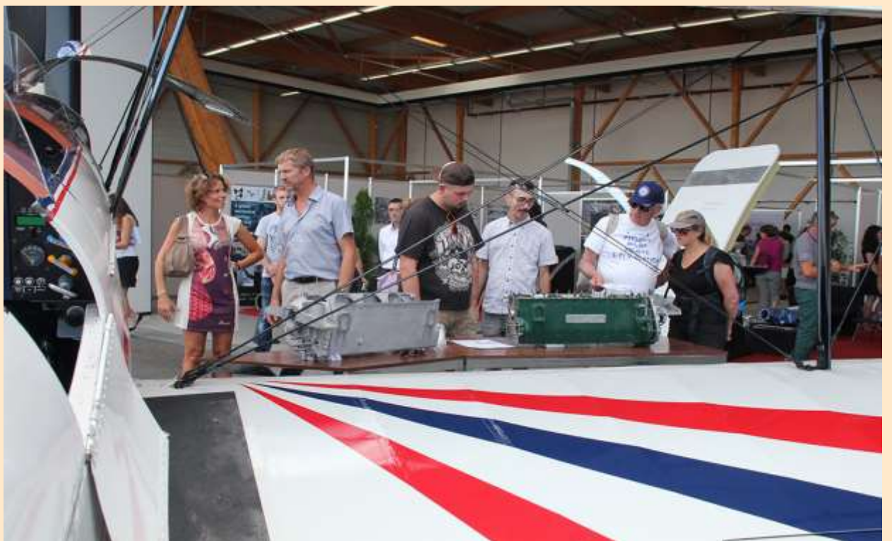
Carter moteur en impression 3D au stand Ventana