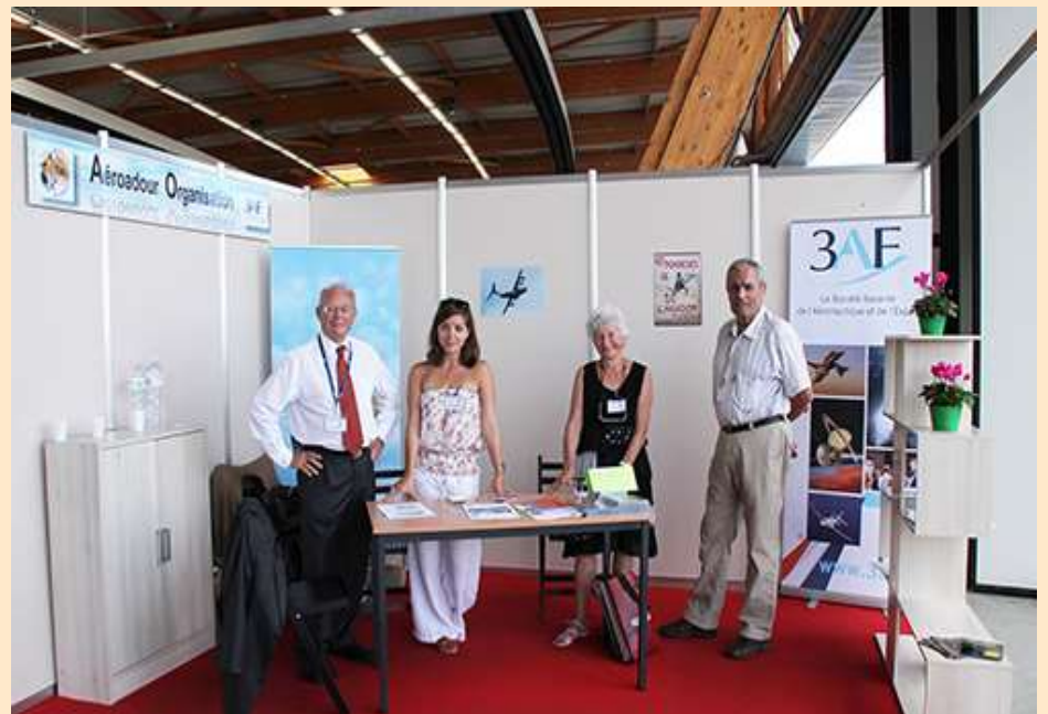
Le « staff » de permanence PWA - 3AF