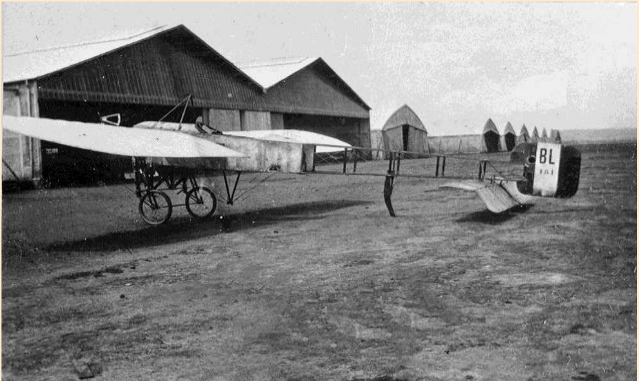
1914 : un Blériot XI de l'aéronautique militaire