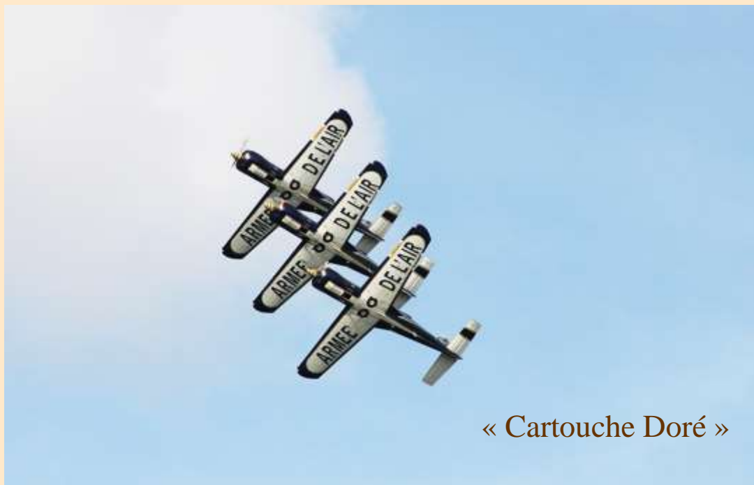
« Cartouche Doré »